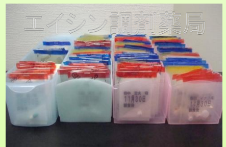
下剤・眠剤などの別包