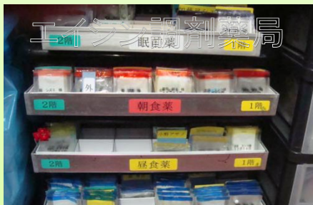
服用時点ごとの色分け