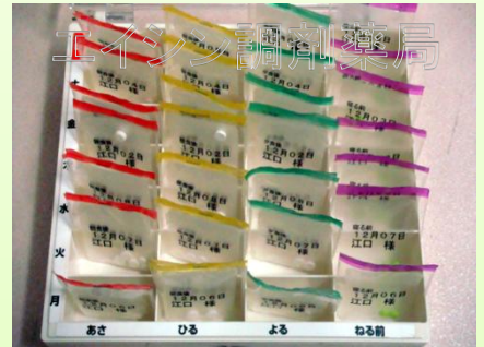
錠剤粉碎や錠剤と散剤の混合