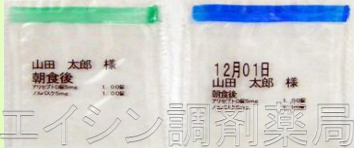
氏名・用法・服用日 薬品名の印字